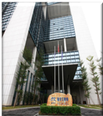
深圳海洋王科技楼

总部海洋王科技楼位于深圳市，总部制造中心工业园位于东莞市松山湖，另有北京、成都、郑州等海洋王办公大楼基地，员工总人数3000人左右。