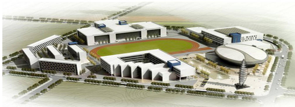
海洋王东莞松山湖工业园